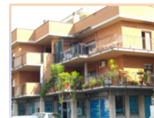
Struttura Villa Adriana

Sono da escludere dalla disposizione sulla compartecipazione gli utenti in carico ai DSM di età compresa dai 18 ai 25 anni, per i quali la retta è a totale carico del fondo sanitario (DRG 943/17).