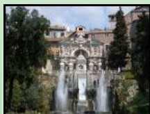
Villa D'Este - XVI sec.