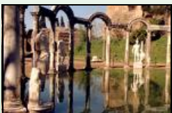
Villa Adriana - II Sec. d.C.