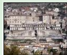
Santuario Fortuna Primigenia - II Sec. a.C.