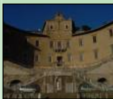
Museo Nazionale Archeologico